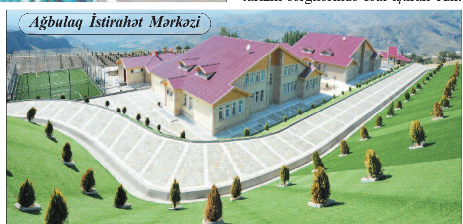
Ağbulaq İstirahət Mərkəzi

Naxçıvan Muxtar Respublikasının da geniş turizm potensialı vardır. 250-dən çox mineral və müalicə əhəmiyyəti su mənbələrinin mövcudluğu, zəngin mətbəxi, qədim tarixi və mədəniyyəti Naxçıvanda turizmin inkişafı üçün geniş perspektivlər açır. Naxçıvan Muxtar Respublikası Ali Məclisinin Sədri cənab Vasif Talibovun diqqət və qayğısı ilə son illər qədim diyarın mədəni irsinin tanıtılması, müalicə mərkəzlərinin yenidən qurulması, həyata keçirilən abadlıq-quruculuq işləri